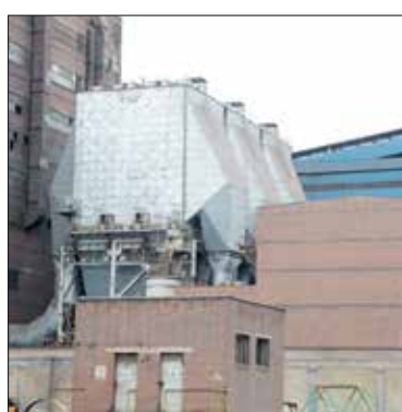
در شماره‌های آتی هفته‌نامه آتشکار ارائه خواهد شد.

های مربوط به این آگلوماشین‌ها (ESP410، ESP310، ESP210) و با هزینه‌ای بالغ بر ۱۴۰ میلیارد ریال نصب گردید و هم‌اکنون در حال بهره‌برداری می‌باشد. وجود فرسودگی در سیستم‌های مربوط قبلی، محدودیت دسترسی به آب، تغییرات خط تولید و همچنین وجود تجهیزات فرسوده و حذف لجن‌های تولیدی توسط سیستم‌های مربوط، اشاره نمود. در ادامه این پروژه، به منظور انجام اصلاحات تکمیلی بر روی الکتروفیلترهای یادشده در راستای حصول استانداردهای زیست محیطی مرتبط با خروجی دودکش‌های آگلوماشین‌ها و بخش آگلومراسیون، پروژه بهینه‌سازی آن‌ها تعریف گردیده است که گزارش‌های مربوطه