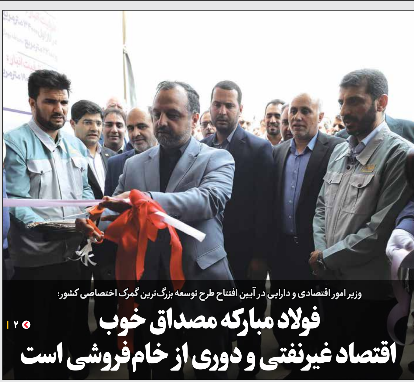
وزیر امور اقتصادی و دارایی در آیین افتتاح طرح توسعه بزرگ‌ترین گمرک اختصاصی کشور:

نشریه داخلی شرکت فولاد مبارکه شماره ۱۳۸۰ شنبه ۲۶ خردادماه ۱۴۰۳ ۸ ذی‌الحجه ۱۴۴۵ ۱۵ آذرماه ۲۰۲۴ MOBARAKEH STEEL GROUP