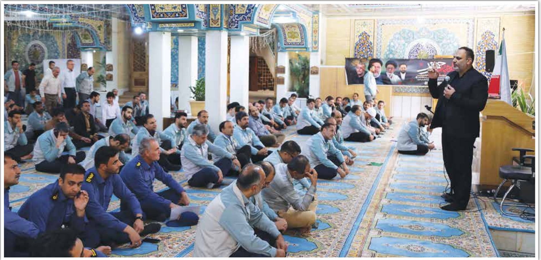
فرمانده لشکر ۱۴ امام حسین (ع) در جمع مدیران و کارکنان فولاد مبارکه تصریح کرد: